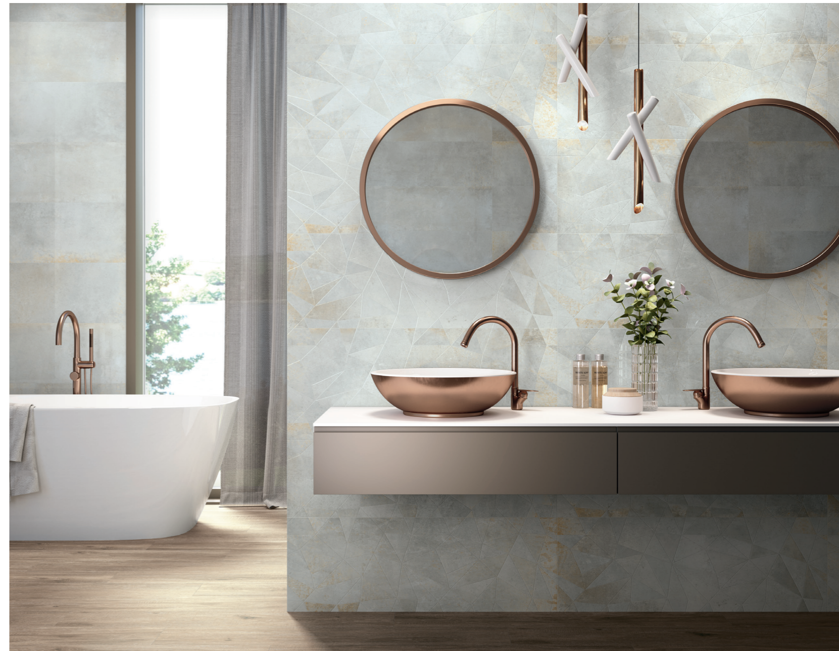
METEORIS NEUTRAL RECT. 35X100 / GLASS NEUTRAL RECT. 35X100 / ALABAMA QUERCIA RECT. 20X120

La colección se completa con dos relieves —Fence e Industrial—, geometrías rectas y curvas llamadas a permanecer inmutables con el paso del tiempo.