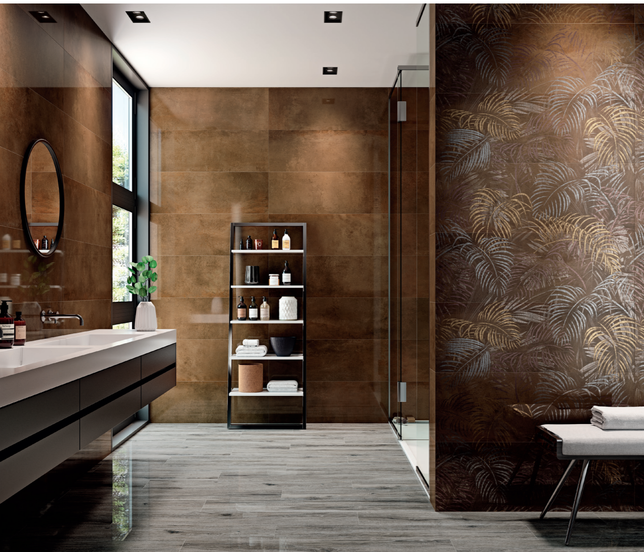
METEORIS OXID RECT. 35X100 / DECOR SET(3) AURELIA OXID 35X100 / QUINTESSENCE GRAPHITE POL. RECT. 22X118

The collection is completed with two reliefs —Fence and Industrial—, straight and curvy geometries destined to remain immutable with the passing of time.