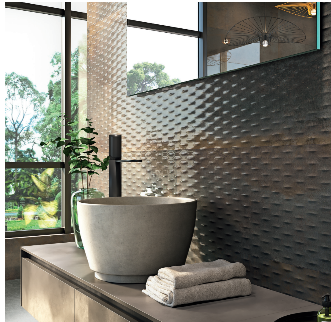
METEORIS GRAPHITE RECT. 35X100 / INDUSTRIAL GRAPHITE RECT. 35X100