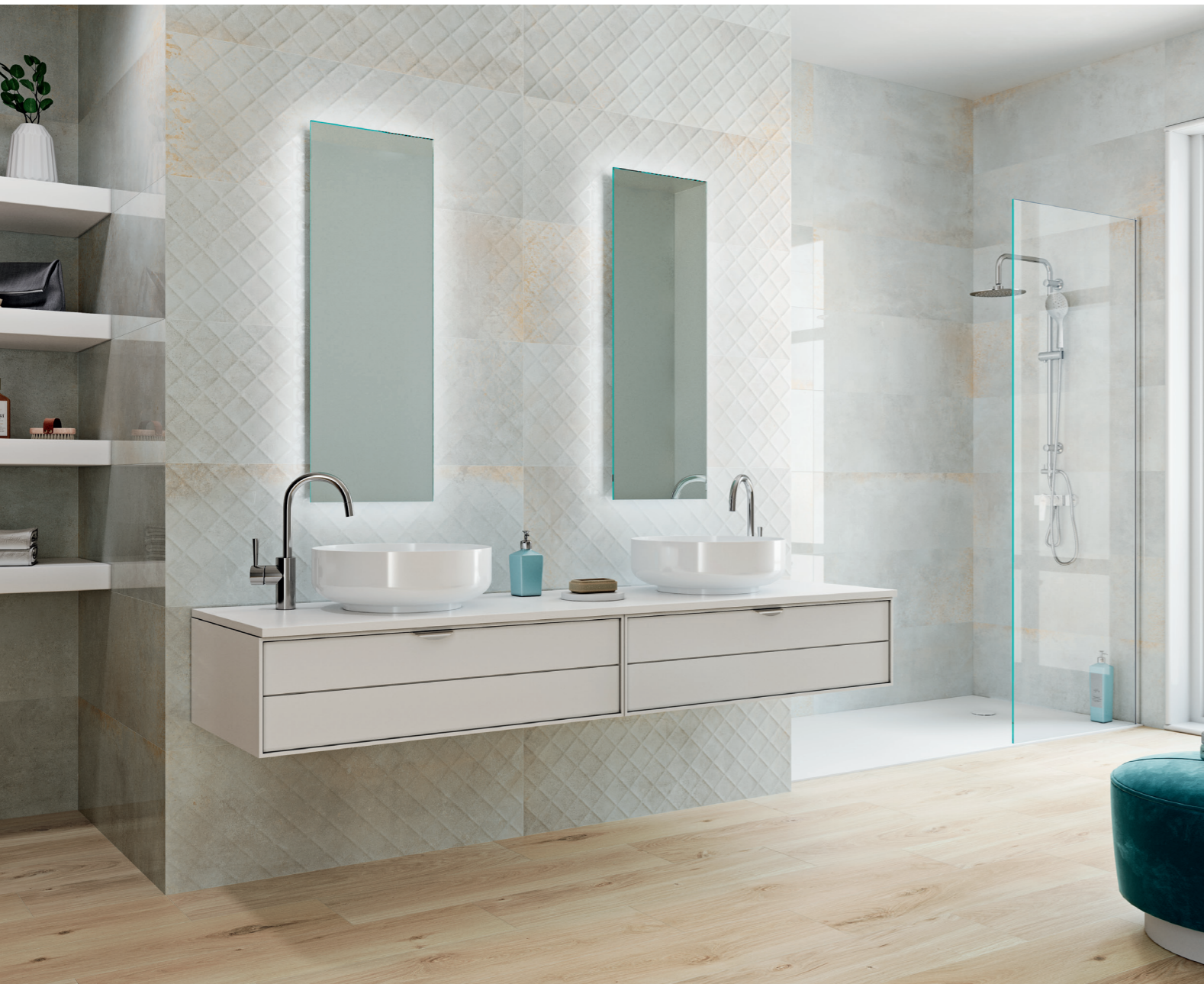
METEORIS NEUTRAL RECT. 35X100 / FENCE NEUTRAL RECT. 35X100