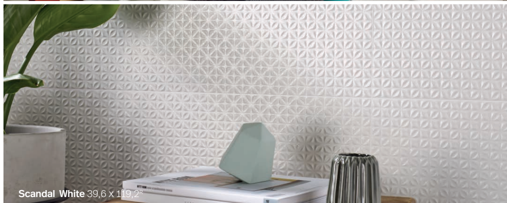
Scandal White 39,6 x 119,2 8