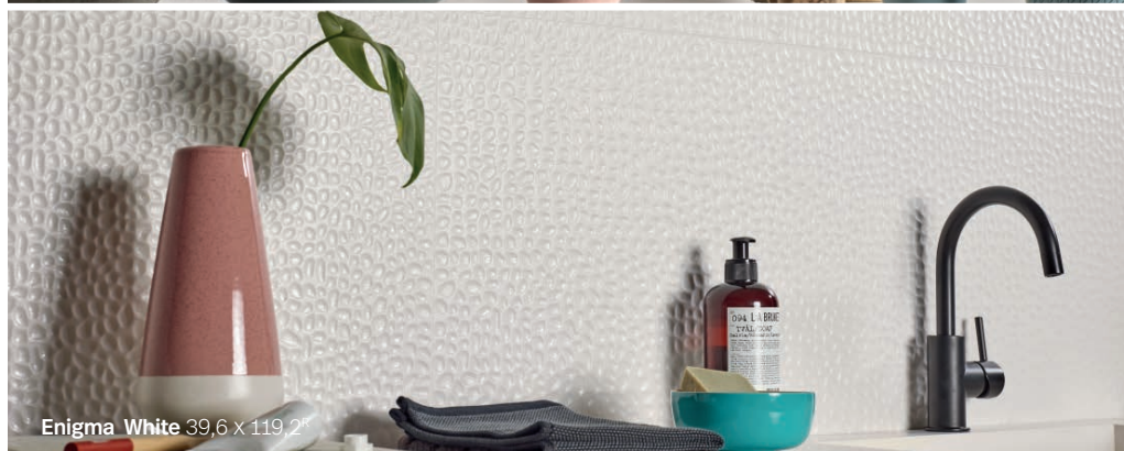
Enigma White 39,6 x 119,2 8