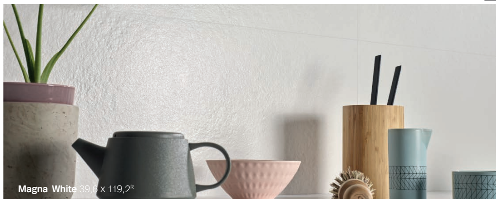
Magna White 39,6 x 119,2 8