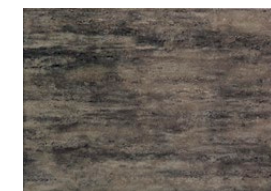
Toscana brąz płytki ścienna 360×250 mm POŁYSK