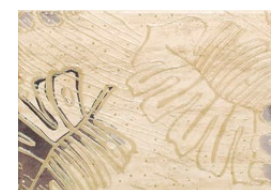
Toscana 1 dekor ścienny 360×250 mm POŁYSK