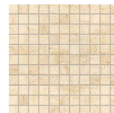
Toscana beż mozaika ścienna 300×300 mm POŁYSK