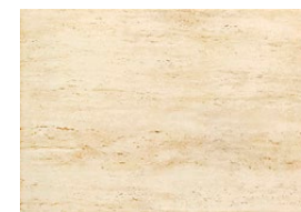
Toscana beż płytki ścienna 360×250 mm POŁYSK

Beżowo-brązowa kolorystyka i egzotyczny roślinny ornament ociepliły wnętrze. Stylowa łazienka zrobiła się przytulna, gdy na parapecie pojawił się niewielki fikus i pamiątki z dalekich podróży.