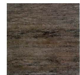
Toscana brąz płytki podłogowa 333×333 mm/8 mm POŁYSK Q III *