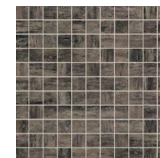
Toscana brąz mozaika ścienna 300×300 mm POŁYSK