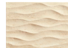
Toscana beż STR płytki ścienna 360×250 mm POŁYSK