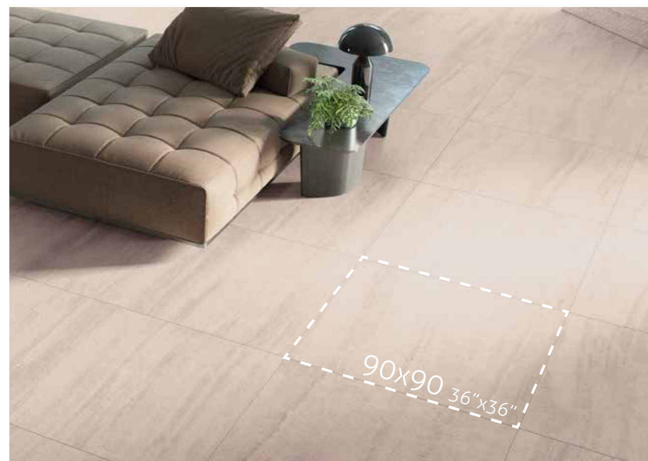
Floor Tiles: Luxury Sand Soft 90x90

Keraben presents its 90 x 90 large size, the new XL square floor tiles that has fewer joins, allowing the design to be better appreciated.