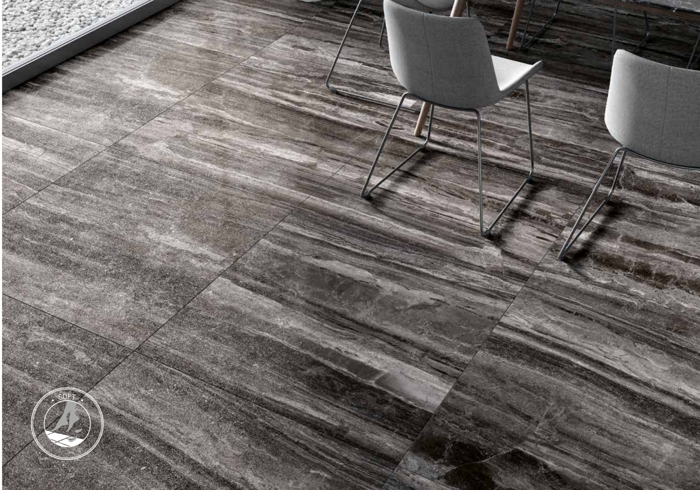
Floor Tiles: Luxury Black Soft 90x90

The soft finish offers an extra silky feel that differs from traditional ceramics, while maintaining all the same technical characteristics. Its matt lappato nature makes it very soft and gives it an exquisite stony, worn effect that sets it apart.