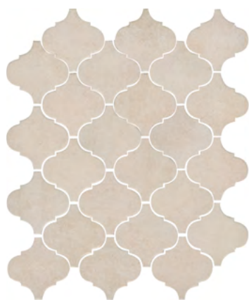
65002 Арабески котто беж 26x30 Arabesques Cotto beige

The Islamic period has rich heritage in Andalusia. This is clearly seen in the Arabic style in architecture and finishing. Typically, terra-cotta tiles were used by Mediterranean artists in geometrical mosaic ornaments known as the arabesque.