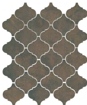
65004 Арабески котто коричневый 26x30 Arabesques Cotto brown