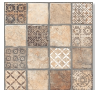
Карфаген 3Д Carthage 3D 400X400mm