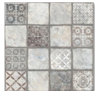
Карфаген 1Д Carthage 1D 400X400mm