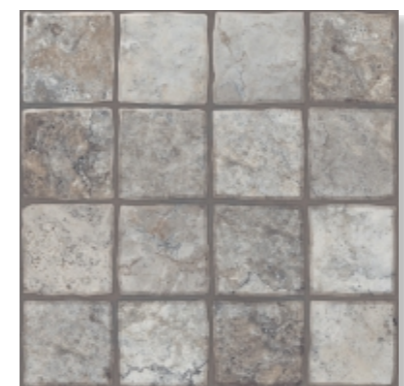
Карфаген 2 / серый Carthage 2 / gray 400X400mm