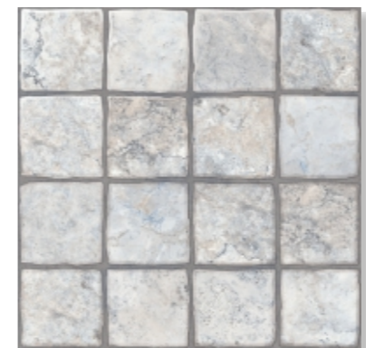
Карфаген 1 / светло-серый Carthage 1 / light gray 400X400mm

Carthage is the capital of the ancient Carthaginian civilization, a city-museum located on the territory of the modern Tunisia. Throughout its history, Carthage was the capital of the state founded by the Phoenicians, one of the largest powers of the Mediterranean. The stone ruins of the ruined city today have become the center of historical and cultural studies. The legacy of the great city and after a series of centuries looks impressive and monumental.