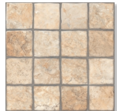
Карфаген 3 / бежевый Carthage 3 / beige 400X400mm