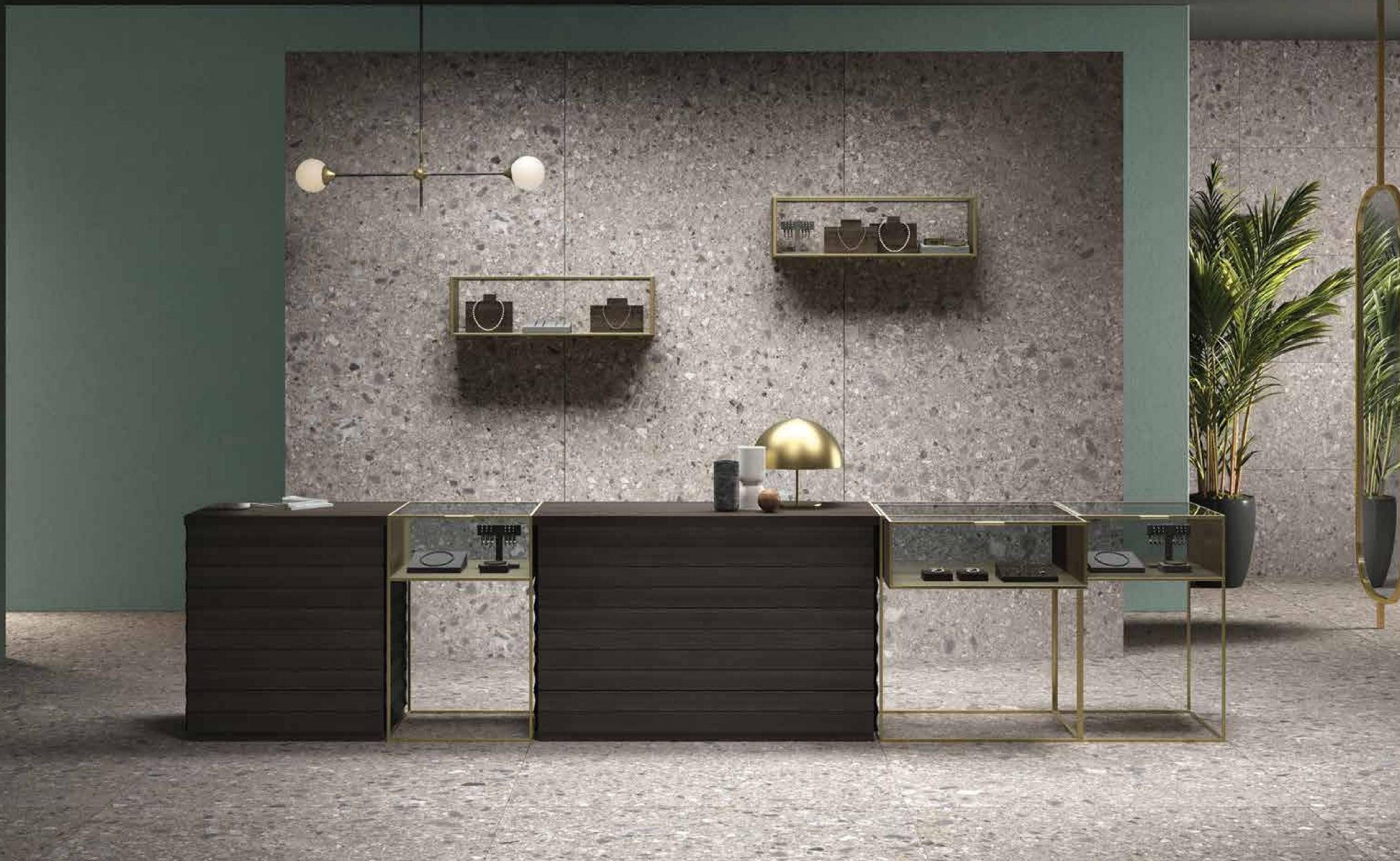
Pavimento - floor: CEPPO | ± 6.5 mm 120x260 cm 48"x100" | Rivestimento - wall: CEPPO | ± 6.5 mm 120x260 cm 48"x100" 50x120 cm 24"x48"