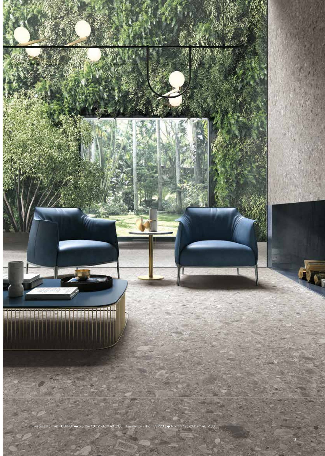
Rivestimento - wall: CEPP0 | 6.5 mm 120x260 cm 48°x100° | Pavimento - floor: CEPP0 | 6.5 mm 120x260 cm 48°x100°