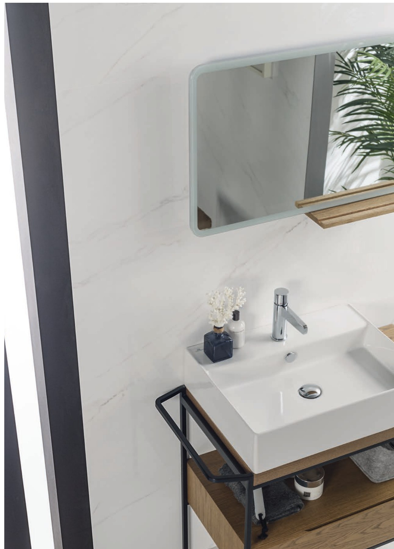
REVESTIMIENTO: THASSOS 45x120cm