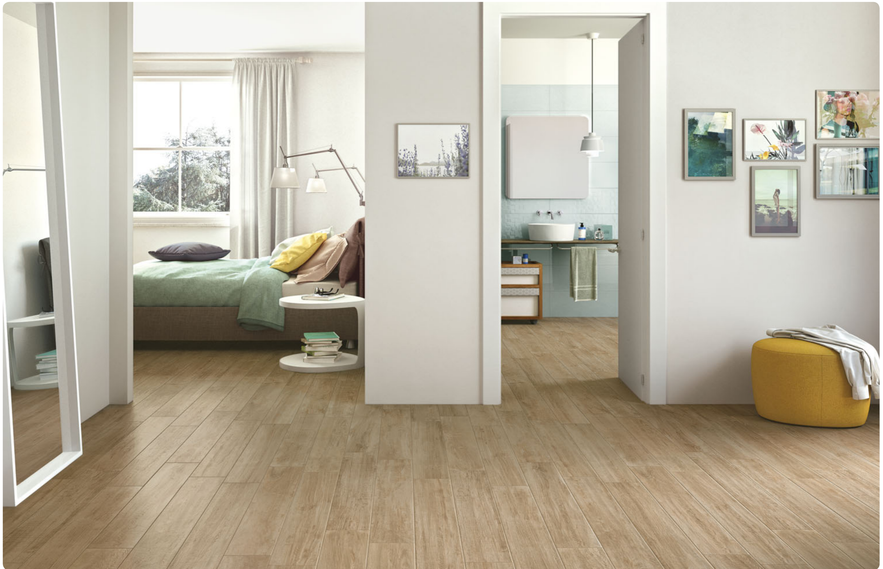
R3TU Woodcomfort Ulivo 15x90