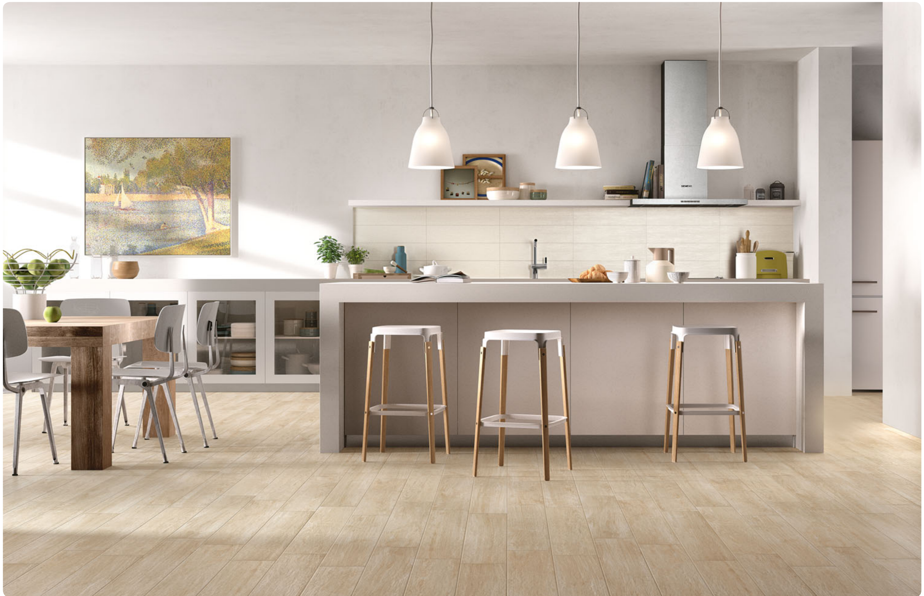
R3TT Woodcomfort Faggio 15x90