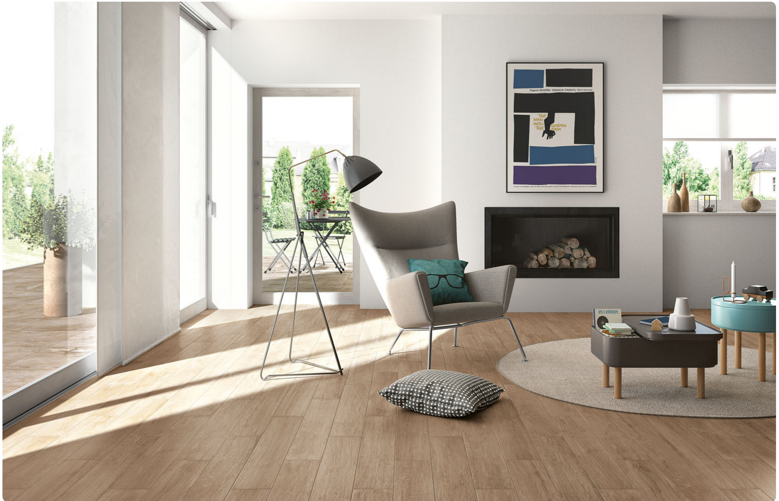
R3TV Woodcomfort Acero 15x90